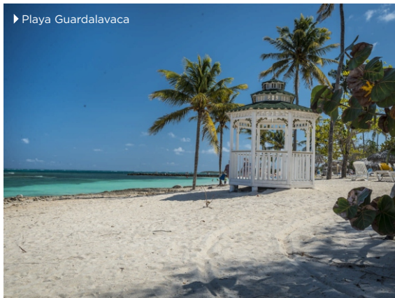
► Playa Guardalavaca

Período estimado para la recuperación de la inversión: 6 años.