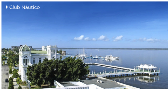
► Club Náutico

Período estimado para la recuperación de la inversión: 5 años.