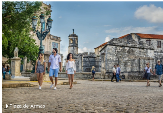
► Plaza de Armas

Período estimado para la recuperación de la inversión: 5 años.