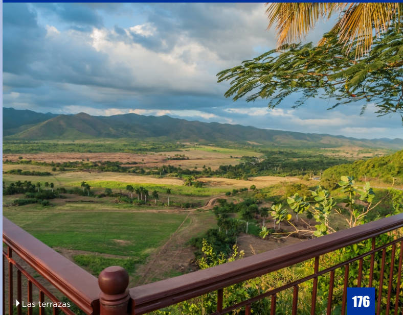
► Las terrazas

Parque naturaleza y de aventuras Cangilones del río Máximo