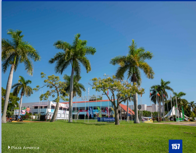
► Plaza América