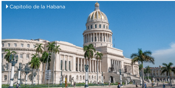
► Capitolio de la Habana

Período estimado para la recuperación de la inversión: 5 años.