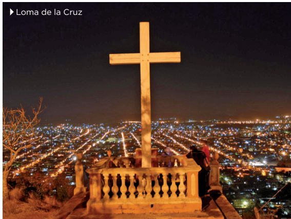
► Loma de la Cruz

Período estimado para la recuperación de la inversión: 6 años.